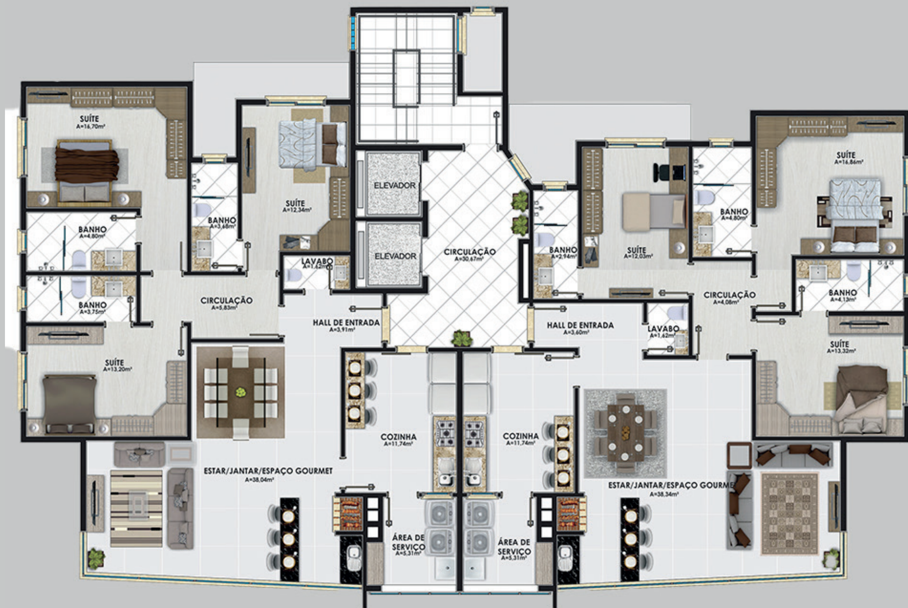
Planta baixa pavimento tipo