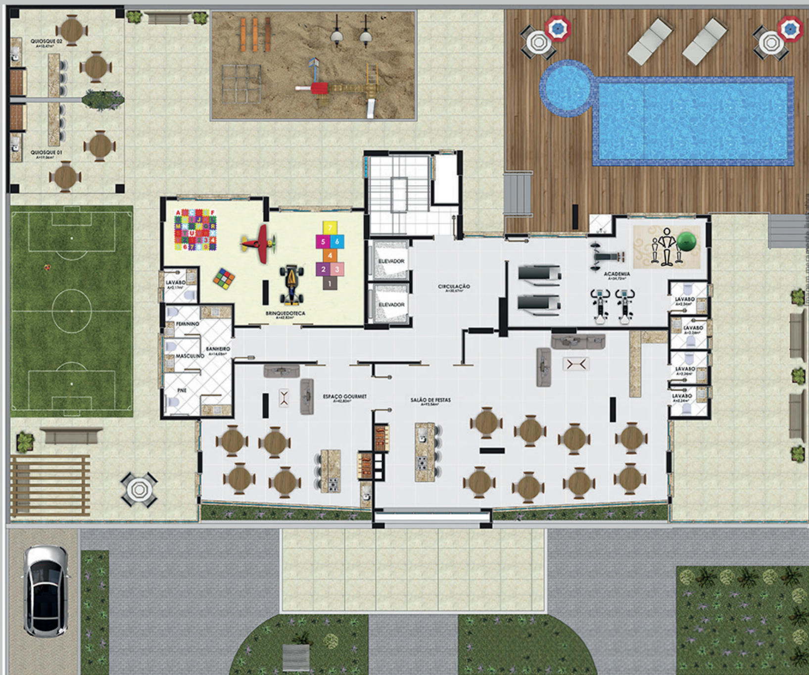
Planta baixa pavimento tipo